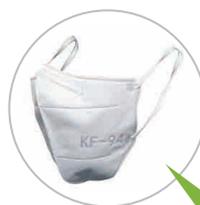
[참고] 보건용 마스크